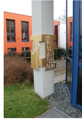
Grundstein der BNS: ΠΑΙΔΑΓΩΓΕΙΝ ΕΙΣ ΧΡΙΣΤΟΝ

Bischof-Neumann-Schule Bischof-Kindermann-Str. 11 61462 Königstein im Taunus Telefon: 06174 / 2999-0 Internet: www.bns.info