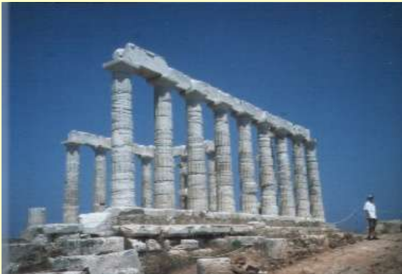
Poseidontempel am Kap Sunion