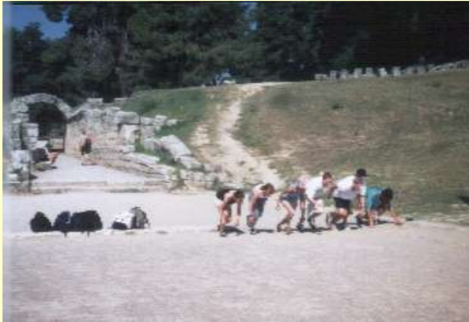
Olympia - unsere Schüler im Stadion