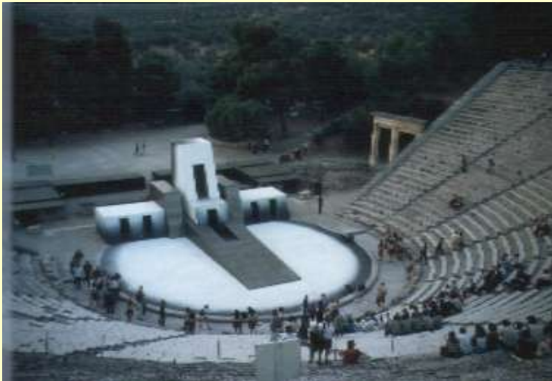
antikes Theater in Epidauros mit modernem Bühnenbild